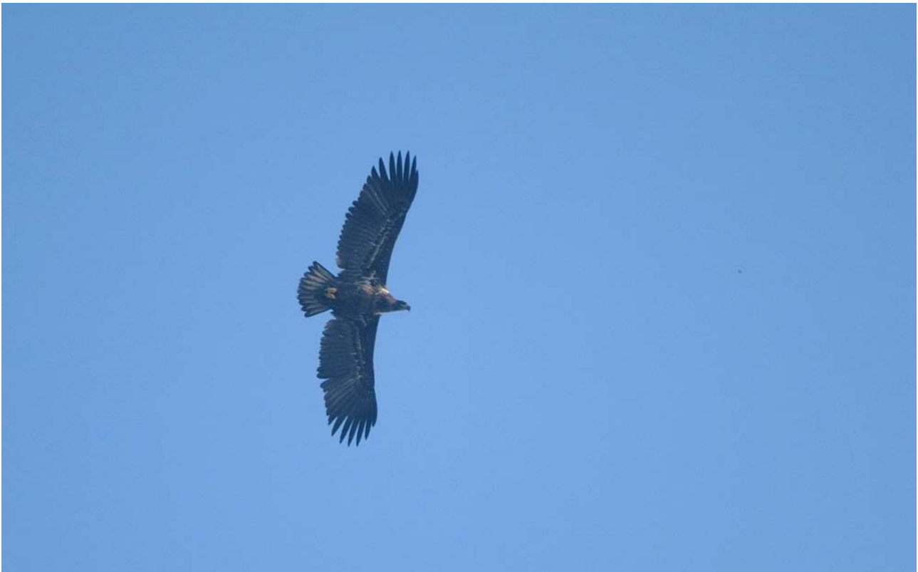
Aquila di Mare, Valli delMincio (MN0504), scattata il 12 / 2 / 2007