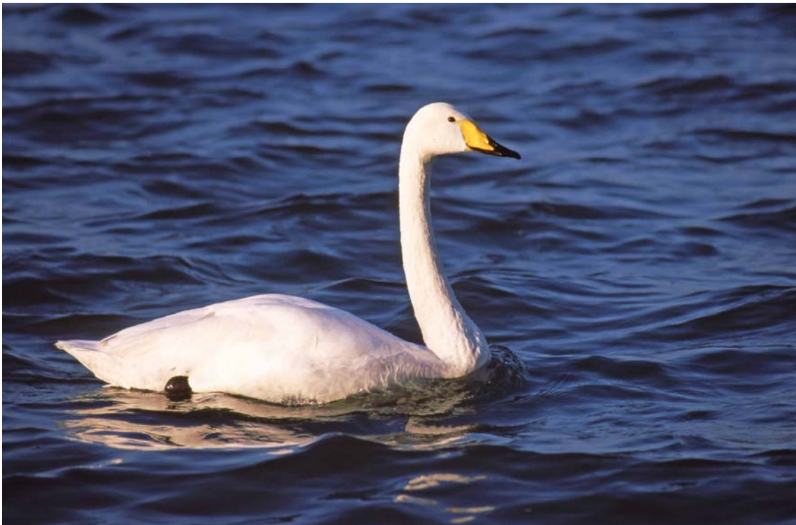
Cigno selvatico, estremamente confidente, Valli del Mincio (MN0504), gennaio 2007

Vigorita V, Rubolini D, Cucé L, Fasola M 2002. Censimento Annuale degli Uccelli Acquatici Svernanti in Lombardia. Resoconto 2002 . Regione Lombardia, Milano.