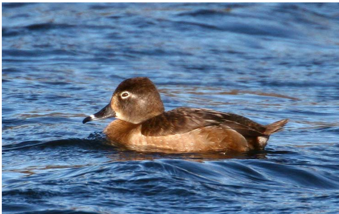
Moretta dal collare, Vasche Torrente Arno (VA0503), gennaio 2007