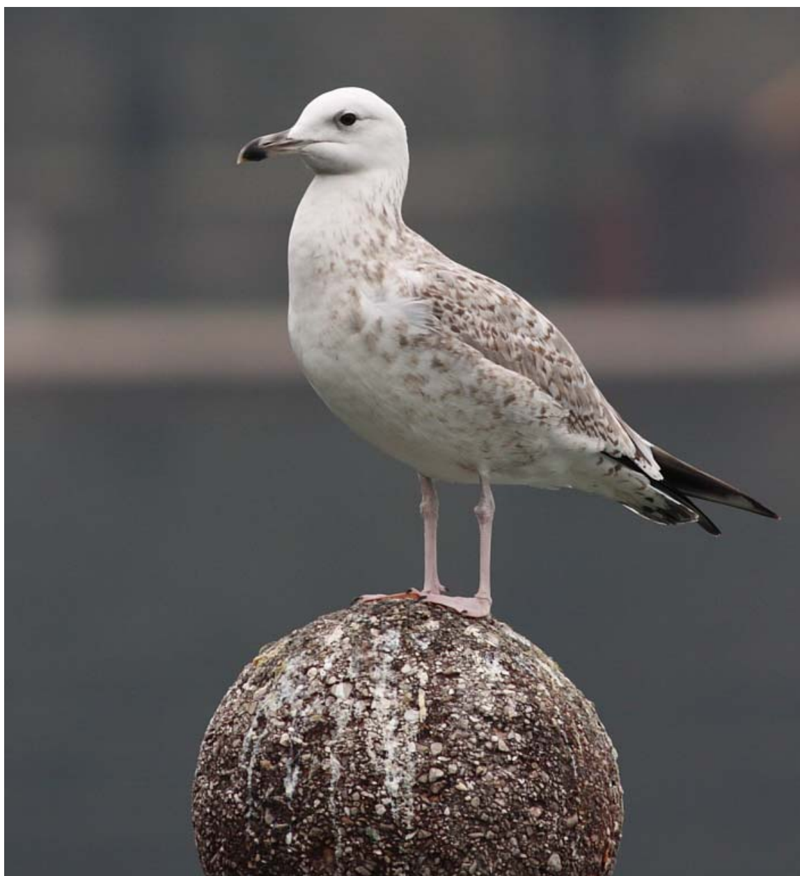
Gabbiano reale orientate(pontico) sul Basso Lago di Garda (BS0103), gennaio 2011.