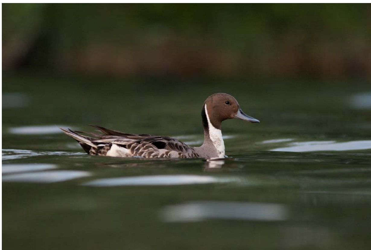
Il Codone è un'anatra poco abbondante in Lombardia che raramente ha superato le poche decine di unità (foto Michele Viganò).